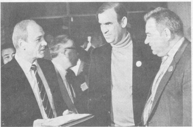
НА СНИМКЕ: участники симпозиума (слева направо): космонавт В. Джанибеков, астронавт из США Д. Ф. Нельсон и космонавт Г. Гречко.

В далеком 1919 году по приказу Наркомздрава Тур-