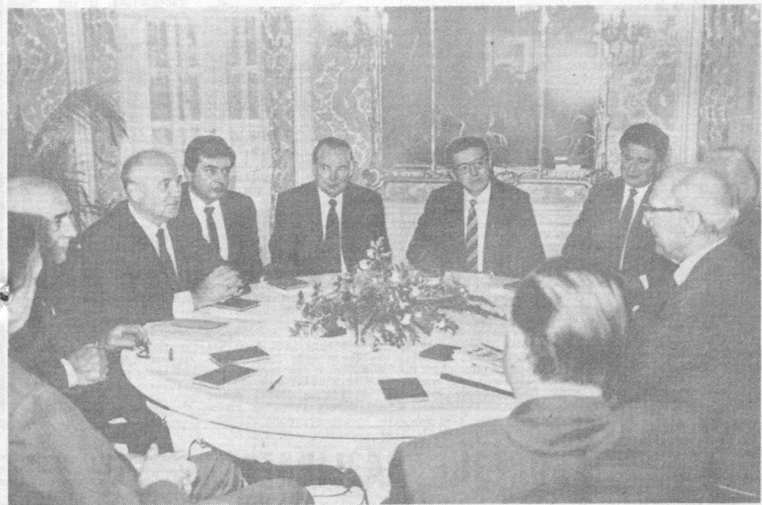
Встреча М. С. Горбачева, принимающего участие в торжествах в связи с 40-летием образования ГДР, с Э. Хонеккером.

Выходит 300 раз в году • № 232 (22098) • Вторник, 10 октября 1989 года • Цена 3 коп.