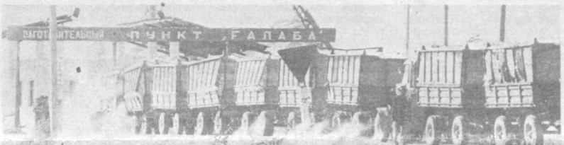
НА СНИМКАХ: на приемном хлопкопункте «Галаба», Зааминского района; электрик-наладчик пункта А. Мадрахимов; тракторный поезд с урожаем.