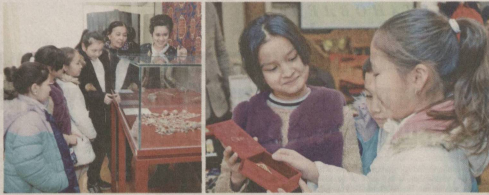
Детство – пора познания.