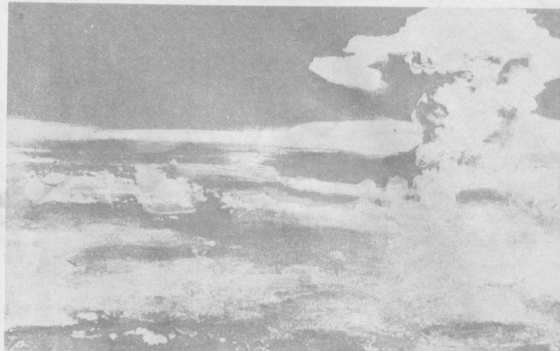
К 40-ЛЕТИЮ АТОМНЫХ БОМБАРДИРОВОК ХИРОСИМЫ И НАГАСАКИ

ИДЕТ РЕКОНСТРУКЦИЯ ЗАВОДА МЕНЯЕТ ПРОФИЛЬ Только название осталось прежним: «Красный Октябрь». Это предприятие — старейшее в Хорезме — издавна занималось выпуском хлопкового масла и мыла.