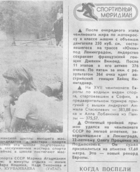
Сразу несколько юных воспитанников республиканской школы высшего мастерства по конному спорту выполнили норму наездников 2-го класса.

Многие плакаты, хоть и отличаются символично-аллегорической глубиной, яркостью мысли, с точки зрения изобразительности не являются шедеврами. Они просто «перетягиваются» на улицах и площадях, поскольку созданы как интимно-интерьерные произведения.