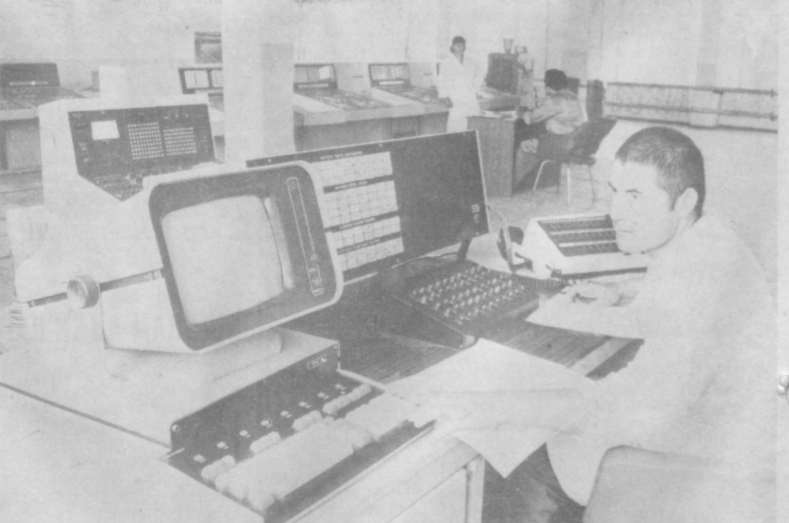
Г. ШАКАЕВ, Корр. «Правды Востока».