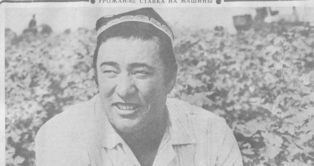
35 центнеров на круг вместо 29 обязались получить в нынешнем году хлопководы колхоза имени Свердлова Среднеирчирского района Ташкентской области. В хозяйстве четко организованы все полевые работы, уход за растениями ведется на высоком агротехническом уровне. На каждом кусте накоплено более десяти коробочек.

Сейчас механизаторы получают премию по итогам года. В августе хлопчатник нуж-