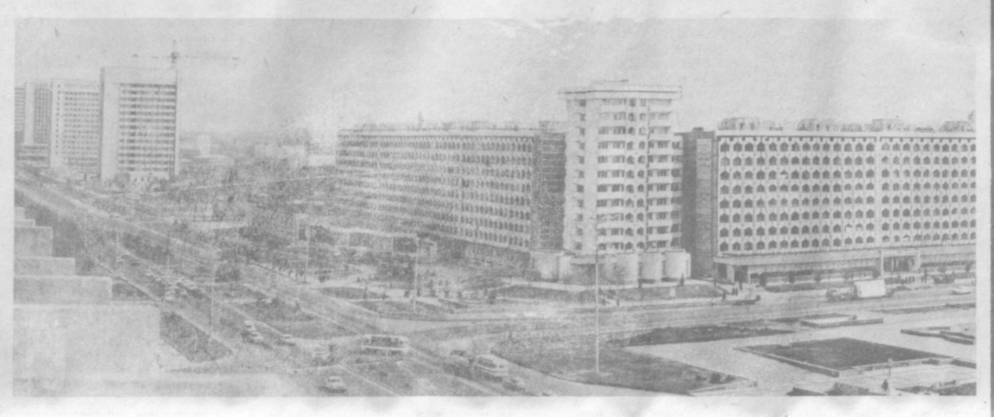
«Алмазар» — в переводе «Яблоневый сад». С незапамятных пор называлась так эта местность. Но до недавнего времени здесь были кривые улицы с ветхими глинобитными домами. Сейчас в «Алмазаре» в домах улучшенной планировки живут 4.000 человек. При возведении его были учтены ошибки прошлого, когда объекты соцкультбыта намного отставали от темпов сдачи жилья. Построены школы, детский сад, Дом счастья, кафе, шесть крупных магазинов, коммунально-бытовые предприятия, в каждом дворе отличные оборудованы детские игровые и спортивные площадки.

Первых покупателей приняла новый двухэтажный магазин спортивных товаров «Олимпия» в Фергане. В торговых залах общей площадью тысяча квадратных метров разместились восемь секций. Те, кто дружит со спортом, могут приобрести здесь все необходимое.