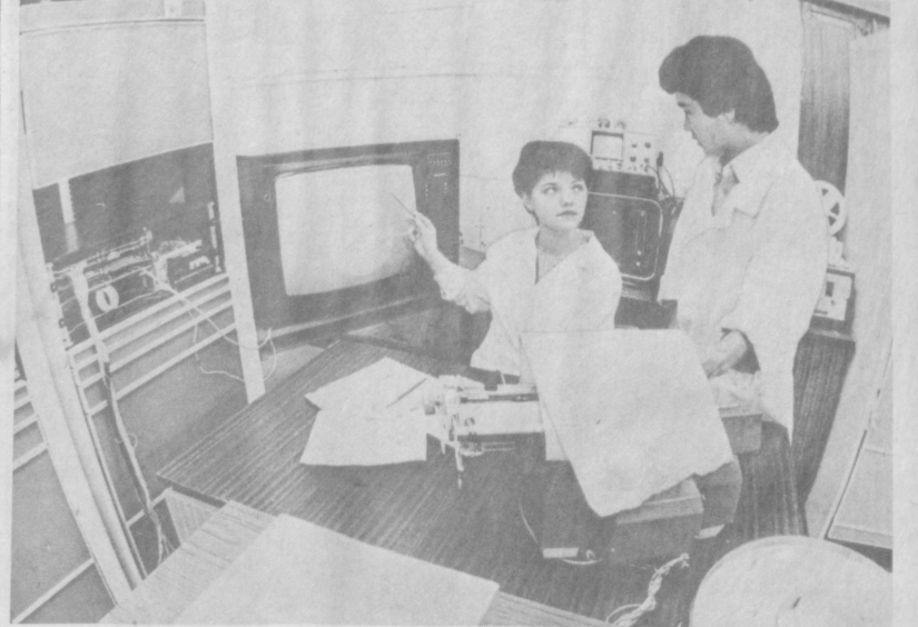
Автоматизированную систему управления для Балаксовской атомной электростанции разработали и подготовили к отправке специалисты проектно-конструкторского и технологического бюро Ташкентского производственного объединения «Средэлектроаппарат». Здесь создаются комплексные автоматизированные системы управления и для атомных, и для тепловых электростанций страны.

К. ЦИКАНОВ, Сиб. корр. «Правды Востока», Хивинский район, Хорезмская область.