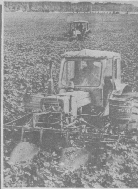
Снижение себестоимости хлопка, улучшение качества волокон и увеличение его выхода — вот проблемы, которые urgentно решают труженики совхоза имени Юлиуса Фучника Арнаевского района Джизакской области. Уход за растениями здесь ведут по всем правилам агротехники.

Вместе с тем Советы народных депутатов и хозяйственные органы области не приняли достаточных мер по выполнению решений о сохранности жилищного фонда и полной ликвидации барачных. Многие дома ремонтируются некачественно, без