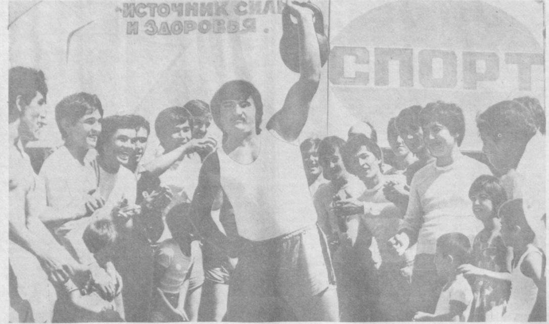
Многолюдно в выходные дни на стадионе «Старт» Ташкентского авиационного производственного объединения имени В. П. Чкалова. Здесь регулярно проходят дни здоровья, в программе которых — соревнования по наиболее доступным видам спорта, спартакиады между цехами и отделами объединения.

Пришли под вечер. И снова тишина. У ворот на скамейке сидит сторож, только уже другой. Произошла смена. — Какое соревнование в воскресенье? — Едем на стадион «Юность», где по программе той же спартакиады должны соревноваться городошники. И здесь никого. Решили посетить старейший стадион «Локомотив».