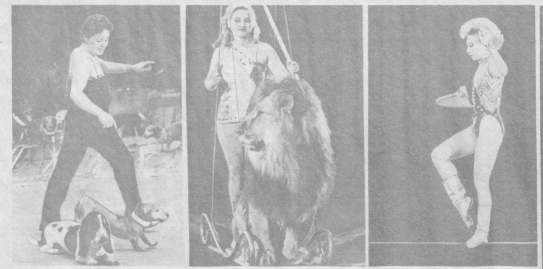
С большим успехом проходят в Ташкентском цирке выступления артистов советского цирка из других городов страны. Они пользуются большой популярностью у ташкентцев.