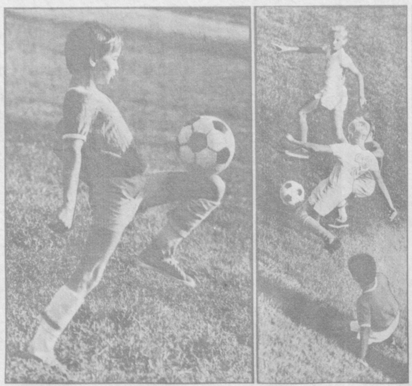
Футбол — это вдохновение. (На снимках: тренировка юных футболистов спортивной школы олимпийского резерва «Пахтакор»).

В предгорьях Памиро-Алая состоялась генеральная репетиция наблюдений кометы Галлея. В ее роли предстало на этот раз другое блуждающее светило — комета Джаккобини-Циннера. С этим «дублером» астрономы Узбекистана отработали новую методику исследований и оперативной передачи полученных данных.