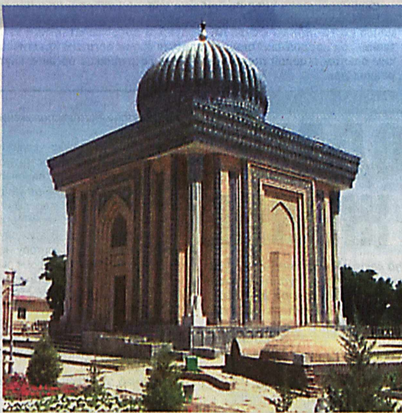
17 ноября (2000 года) – день открытия мемориального комплекса Имама Мотуриди.