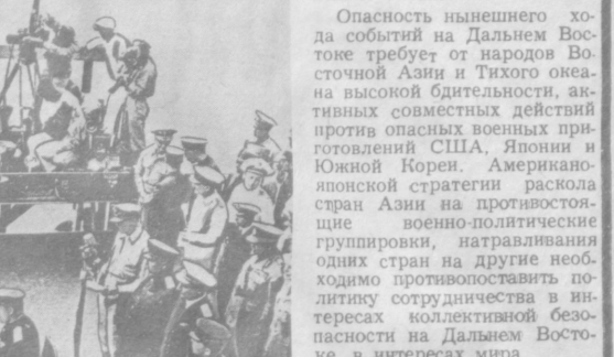
Василий ПЕТРОВ, Маршал Советского Союза, первый заместитель министра обороны СССР, Герой Советского Союза. НА СНИМКАХ: над Юнгином Сахалином советский флаг; подписание акта о капитуляции Японии.

В результате разгрома фашистской Германии и милитаристской Японии были ослаблены реакционные силы империализма. Используя плоды военных побед, народы многих стран Азии освободились от колониальных пут и национальной зависимости, стали на путь экономического и социального прогресса. Но правящие круги Японии, позабыв уроки прошлого и опираясь на всестороннюю помощь империалистов США, в настоящее время осуществляют милитаризацию страны. Под предлогом обеспечения взаимной безопасности Япония продолжает представлять свою территорию для размещения американских войск, базирования военно-морских и военно-воздушных сил. В радиусе возможного действия их находится не только советский Дальний Восток, Сибирь, но и территория МНР и других государств Азии и бассейна Тихого океана.