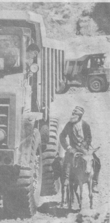
Встреча в горах.

В конце предстоящей недели предвидается увеличение облачности. В среднем за неделю температура воздуха прогнозируется близкой к средним многолетним значениям. (УзТАГ).