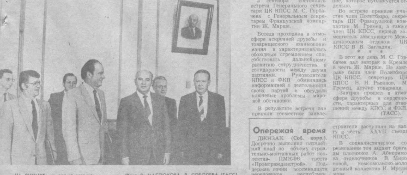
НА СНИМКЕ: во время встречи.