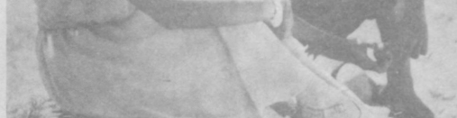
Картина создана на киностудии «Узбекфильм». Авторы сценария — Д. Исхаков, Э. Ишмухамедов. Режиссер-постановщик — Э. Ишмухамедов.

В центре сюжета лирической киноповести — образ молодого нашего современника, человека трудной судьбы. О его нравственном становлении, о яркой, романтической любви двух молодых людей — Тимура и Ульфат рассказывает этот фильм.