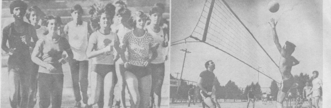
Крепко дружат с физкультурой и спортом на Ташкентском текстильном комбинате. Не пугают багровые дорожки и игровые площадки стадиона «Текстильщик» после рабочего дня.

9.00 «Время». 9.40 «Меньший среди братьев». 2-я серия. 10.55 «Клуб путешественников». 11.55 Играет квинтет духовых инструментов «Серенада». 12.35 Новости. 15.00 Новости. 15.20 Документальные фильмы. 16.10 Концерт. 16.45 Песня К. Кулиева. 17.15 Музыкальный фильм. 17.30 Документальный фильм. 18.20 Фильм-концерт. 19.15 «Сегодня в мире». 19.30 «Ровесник». Киножурнал. 19.40