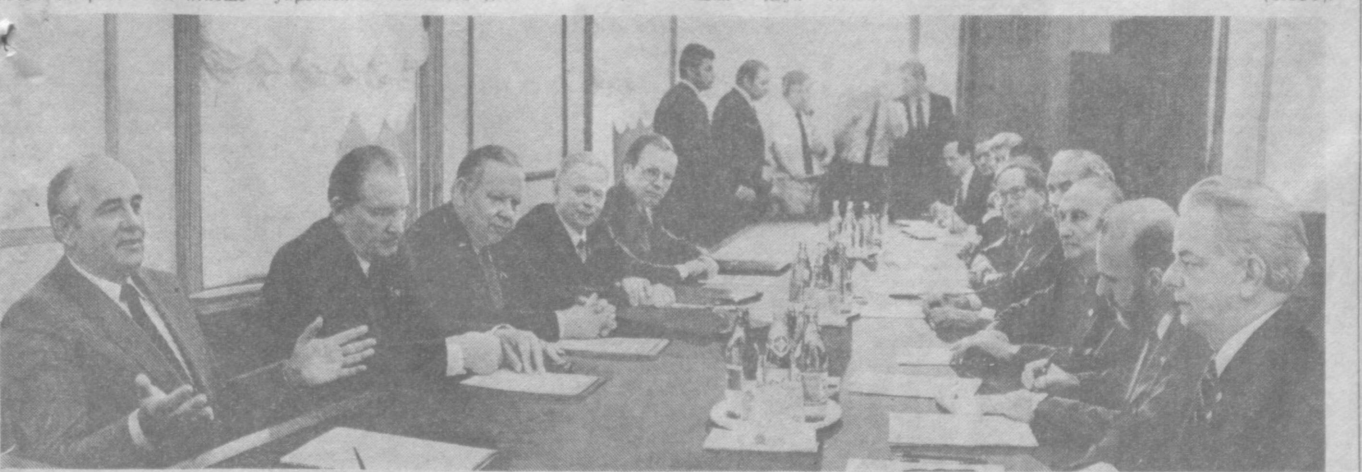
Во время беседы.

По заключению лабораторий, основанном на показанных приборах, качество полученного волокна отвечает самым высоким требованиям государственного стандарта. Это результат проведенной в течение лета модернизации предприятия: здесь действуют новые воловоотделительные аппараты, а также очистители типа «Мехтан», заменяющие машины прежних марок. Очистка сырья ведется на двух поточных линиях. (УзТАГ).