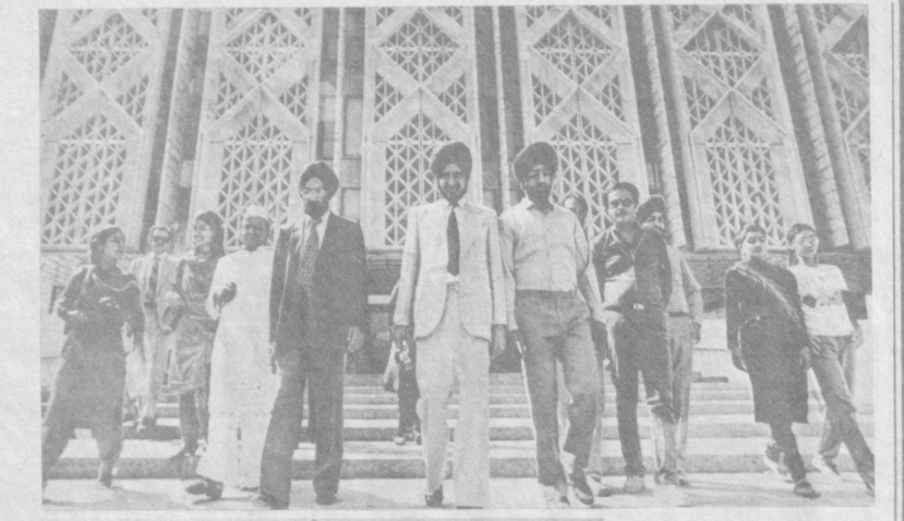
ДНИ ИНДИИ В УЗБЕКИСТАНЕ

ТАШКЕНТСКОЕ БЮРО ПУТЕШЕСТВИЙ И ЭКСКУРСИЙ приглашает вас совершить увлекательные путешествия в ОКТЯБРЕ, НОЯБРЕ, ДЕКАБРЕ.