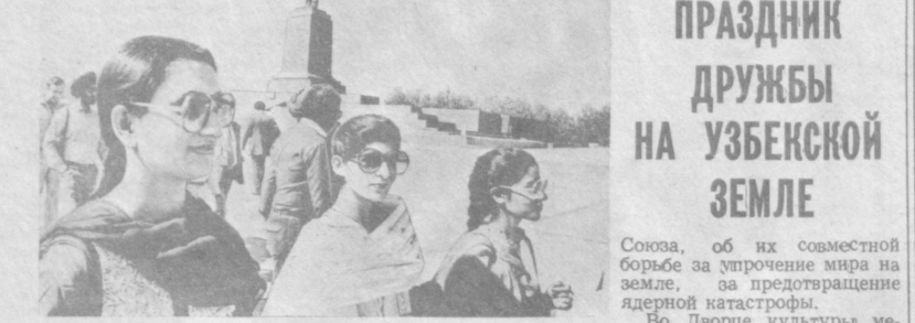
НА СНИМКАХ: гости из Индии знакомятся с Ташкентом.

Дни Индии начались в Узбекистане. Для участия в этом празднике дружбы в Ташкент прибыла делегация индийского штаба Пенджаб — ее возглавляет канцлер Пенджабского университета Джюал.