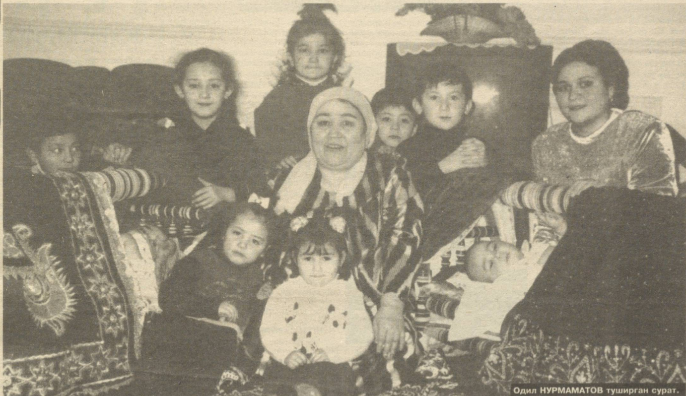
Одил НУРМАМАНОВ туширган сурат.

Пойтахтимизнинг Ҳамза туманида истиқомат қилувчи Муҳаббат Раҳимов яшайдиган хонадонга 1 дам кўйганимда бу ерда ўзгача осойишталик, саришталикни ҳис этдим. Опа билан бошлашиб хонага кирдик Муҳаббат ая дарс тайёрлаб ўтирган невараларини оналик меҳри билан суйиб, мактабга қузатди.