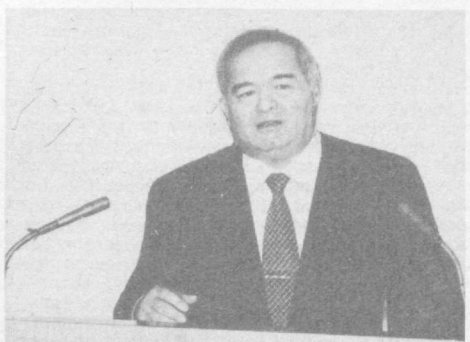
СУРАТЛАРДА: йўналиш пайти.

26 февраль куни Президент Ислам Каримов раислигида республика Вазирлар Маҳкамасининг 1996 йилда Ўзбекистонни ижтимоий-иқтисодий ривожлантириш йўналишлари ҳамда 1997 йилда мамлакатимизда амалга ошириладиган иқтисодий ислохотларнинг устувор йўналишларига бағишланган мажлиси бўлди. Унда вилоятлар ва Тошкент шаҳри ҳокимлари, вазирликлар, давлат қўмиталари, концернлар, корпорациялар, уюшма ва идораларнинг раҳбарлари иштирок этди.