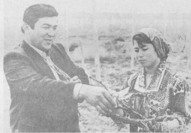
Касби туманида «Майма» жамоа ҳужалиги боғ-дорчилик ва узумчиликка ихтисослашган. Утган йили жамоа олма, шафтоли, бодом ва узумдан мўл ҳосил етиштирди. Айни чоғда жамоада янги кўчатлар экилиб, мевали боғ ташкил этиляпти.