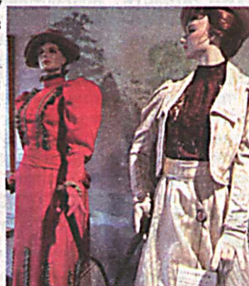
Одежда теннисисток в начале века.

широкие шаровары, которые постепенно сузились и укоротились. Словом, за несколько десятилетий спортивная одежда претерпела значительные изменения. Сравните хотя бы фото-