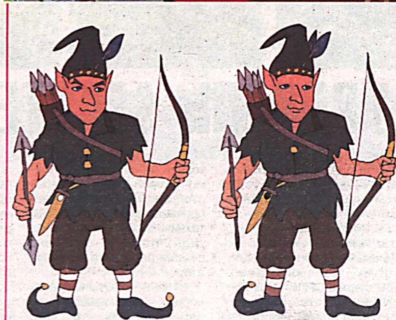
Найдите 10 отличий.