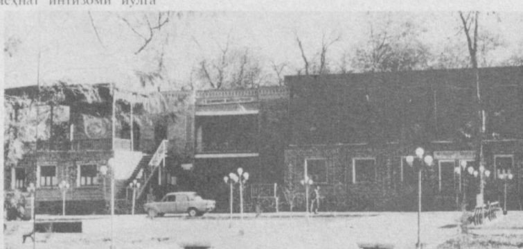
• Зомин туманидаги Охунбобоев номли маҳалла гузари. Катта «Осиё» карвонсарой бозори.