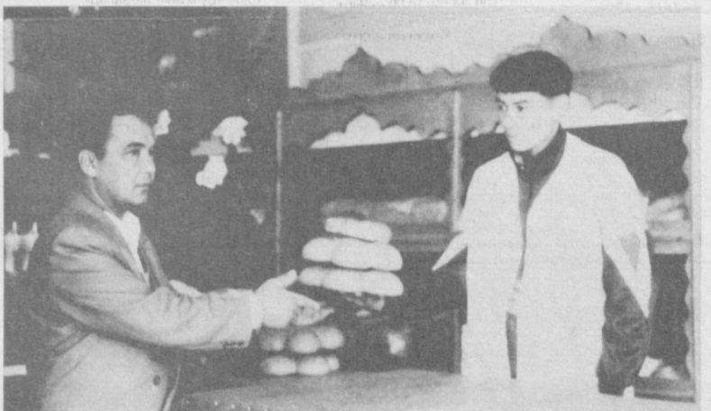
• Жиззахдаги «Қалия» маҳалласида янги ишга туширилган иссиқ нон пехнининг махсус дўкони.

дан юқори ҳосил кўтарган хужаликлар кўп. Қайси деҳқон кузда ер чизиб қолишни истайдилар? Режани қойиллаштириб ҳалол меҳнати наҳидасини сураётган «Тараққиёт», «Навбахор», «Юксалиш», «Янги ҳаёт», Ҳамид Олимжон, Ҳамроқул Носиров, Улугбек номли жамоа хужаликлар заршунослари пахтачиликда узига хос мактаб яратди. Баъзи хужа-