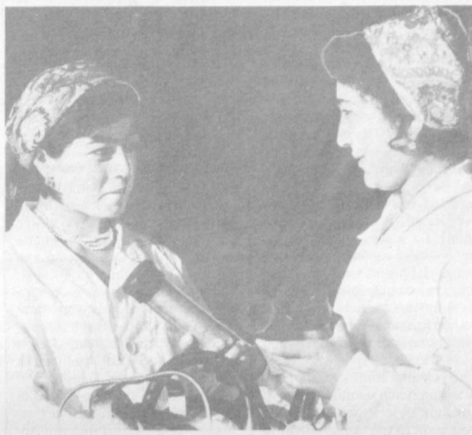
Самарқанд вилояти пахтакорлари бу йил ҳар қачондан ҳам фидокорона меҳнат қилдилар ва давлатга 250 миң тоннадан зиёд саноат хом ашёси етказиб бердилар, бошқа соҳаларда ҳам сезиларли муваффақиятларга эришилди.

Рашид БОБОМУҲАМЕДОВ, «Қишлоқ ҳаёти» махсус мухбири.