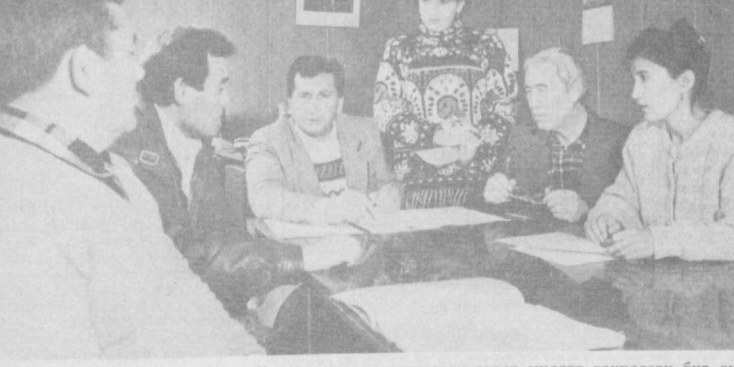
Юқори Чирчиқ туманидаги «Гулiston» корпорациясида турли мидал вақчалари бир ола тўралик дамқор ҳамжамиятида меҳнат қилмоқдалар. Жомалардаги соғом муҳит, илгорлар таърифи ва фан ютуқларининг амалиётта кенг жорий этилиши муваффақиятларнинг бош омили бўлмоқда.

Ушбу суратда фаоллар талдаги вакифалар хуусида Узаро фикрлашмишмоқда.