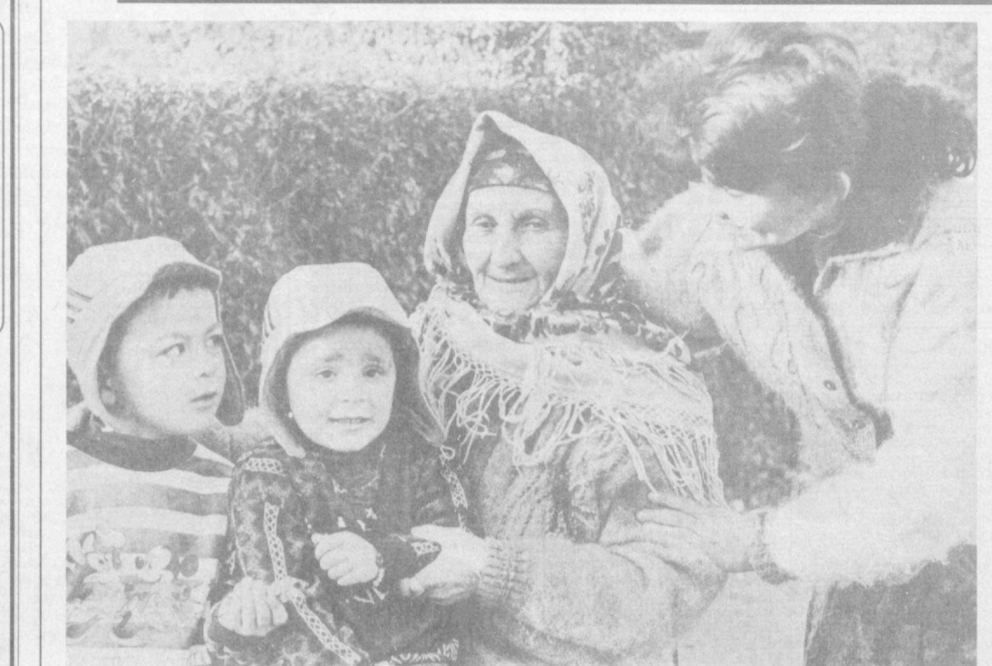
Момолари азииз ўзбекнинг. Шубоиски қишда ҳам баҳор. Қўтилларида кўнди қўраимиз.