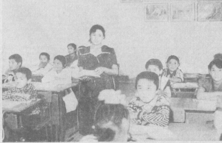
3. РАҲМАТУЛЛАЕВ олган сурат.

Она тили. У миллатнинг ўзаги. Ўзликни таниш ҳам асдила она тилини эгаллаш орқали амалга ошади. Халқ таълим масканларида бу масалага жиддий эътибор қилинмоқда.