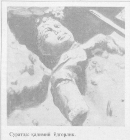
Суратда: қадимий ёлгорлик.

Куёш арқ элиб нур сочиб тирик оламни уз ҳақида фикр-зиқр қилишга мажбур қилганисек, буюк шахслар ҳақида айтилиши ва ёзиллиши шарт бўлган ҳақиқатни тарих айтишга ва ёзишга мажбур қилади, деган маъноларнинг гани ҳақиқат.