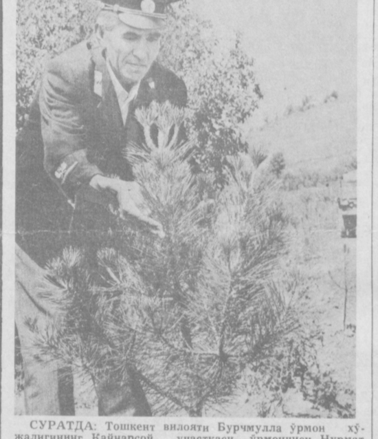
СУРАТДА: Тошкент вилояти Бурчмулла ўрмон хўжалигининг Қайнарсой участкаси ўрмончиси Нурмат И. ПОРТНОВ суратга олган

Ҳужумхуриятимизда ҳотазорларни кўпайтириш ҳаво ҳароратини мўътадиллаштирилади. Сувнинг туғуно ваза қатлидан беронга бўлиб кетилиши чекланди. Масалан, иҳоталанган пгазор очиқ экин майдонига исботан сувни кам талаб этишини уста деҳқон р-и-миз яхши билалар.