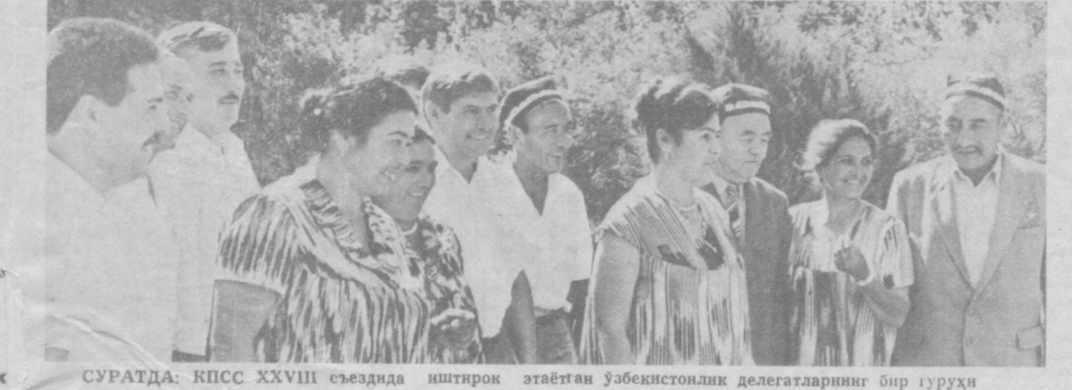
СУРАТДА: КПСС XXVIII съездида иштирок этаётган ўзбекистонлик делегатларнинг бир гуруҳи

Тўғри, саксон бешинчи йил баҳорини аниқ тасаввур этмай туриб бугунги аниқлаш қийин. Аммо, биз ҳозир шундай бир аҳволга тушиб қолдикки, партия учун ҳам, қайта қуриш, одамлар учун ҳам энг муҳими — бугунги ва эртанги аниқлаш. Бундан бошқа йўлнинг ҳаммаси жамият тақдирини тубсиз жарикли сари етаклайди. Хўш, модомки аҳвол шундай экан, ишни нима-