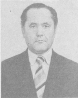
Сиз бу гапларни ўзининг тарихи ва анъаналарига эга бўлган...