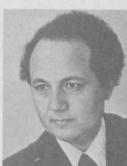
Хурматли Раҳмат Худойбердиев!