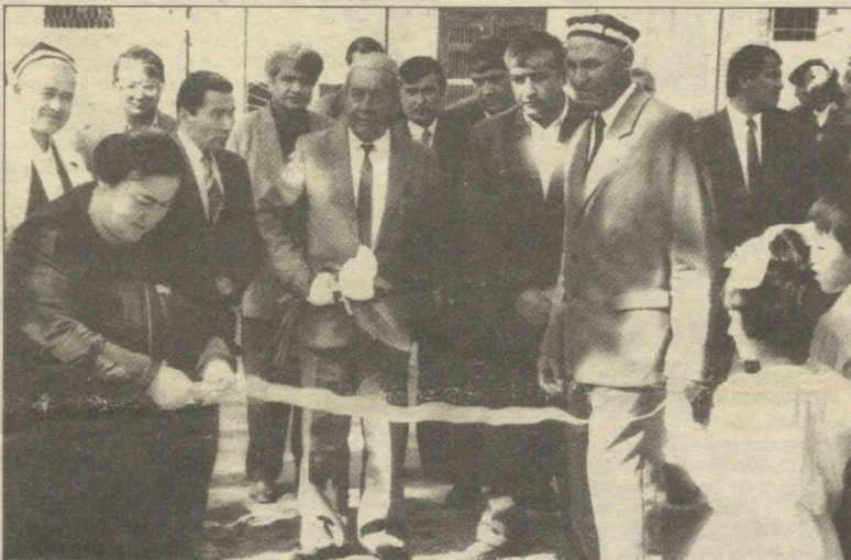
Туманда яна бир янги иншоотнинг фойдаланишга топширилиши лаҳзалари...

овқатланиш хизматини кўрсатади. «Жалолобод» фирмаси қурилиш-таъмирлаш ишларини бажаради. «Тоҳирий-тур» хорижга сайёҳлар жўнатса, «Тоҳирий ором» фирмаси озиқ-овқат маҳсулотлари харид қилиш, қайта ишлаш ва сотиш билан шуғулланади.