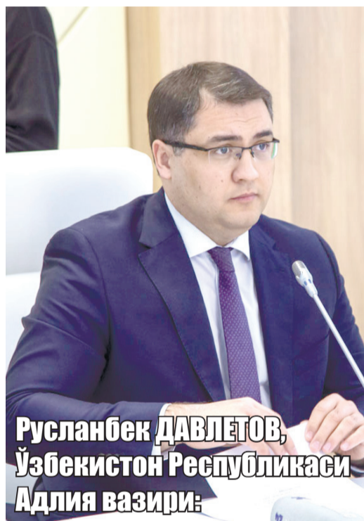
Русланбек ДАВЛЕТОВ, Ўзбекистон Республикаси Адлия вазирлиги

Адлия вазирлиги Русланбек Давлетовнинг “Тошкент ёшлар форуми – 2020” доирасида ташкил этилган “Ҳуқуқий Тошкент — 2030” мавзусидаги очиқ мулоқотидан олинди.