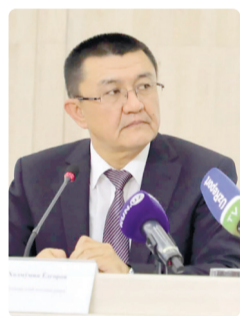
Холмўмин ЁДГОРОВ, Ўзбекистон Республикаси Судьялар олий кенгаши раиси