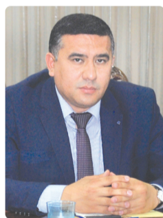
Шерзод АБДИҚОДИРОВ, Судьялар олий кенгаши аъзоси