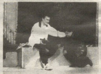
Театрда қўйилган спектакллардан сахна кўрунишлари.

Ёдимда, Академик драма театри-мизнинг "Алишер Навоий", "Отелло", "Ҳамлет", "Шоҳ Эдип", "Шошма кўёш", "Ғариблар", "Қиёмат қарз", "Юрак сирлари", "Сарвқомат дилбарим" каби яна ўнлаб спектакллари-ни томошабинлар қайта-қайта келиб кўришарди. Томоша зали доимо тир-банд эди. Мен ҳам бир умр ушбу те-атрнинг ашаддий мухлисима ва жуда кўп спектакллари уч-тўрт мар-тадан томоша қилганман. Фақат завқ-шавқ олганим учун эмас, ҳаёт ҳақида чуқурроқ мушоҳада юритиш-ни ва инсоний фазилатлар сабоғи-ни ўрганганим, онг-шууриим чирғ-ёққандек ёришгани ва айниқса санъ-аткорларнинг ижросига қойил қолган-им учун ҳам ушбу отахон театр ос-тонасини ҳаммавақт қутлуғ санаб келаман.