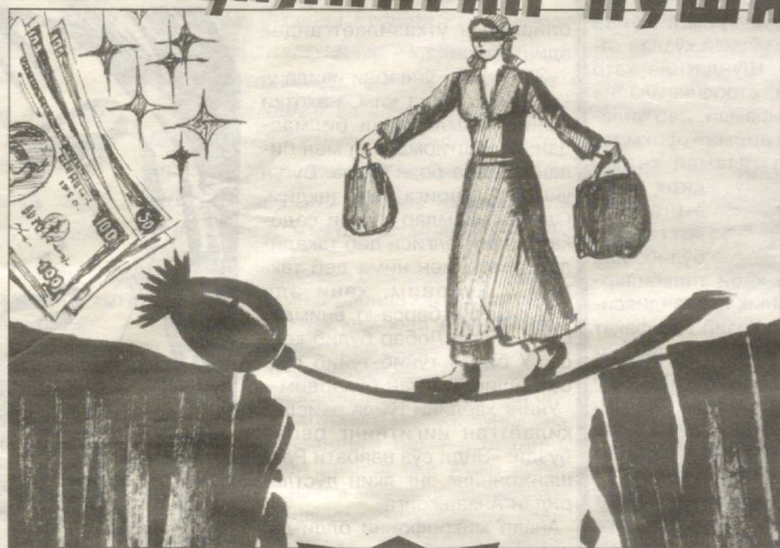
Гиёҳвандлик — аср вабоаси

разадан ўзига боқиб турган кишига. - Тинчлик борми, ўзи?!