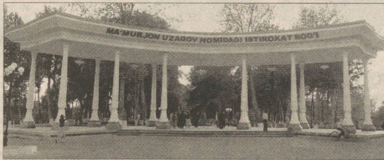
Суратларда: Марғинович ёдгорлик мажмуи; М.Узоқов номидаги шаҳар маданият ва истироҳат боғидаги арка; Марғилон ёшлари ҳар соҳада пешқадам.

Президентимизнинг «Марғилон шаҳрининг 2000 йиллигини нишонлаш тўғрисида»ги қароридан сўнг бу ишлар янги босқичга кўтарилди. Ижтимоий-маданий инфратузилмани ривожлантириш дастури ва корхоналар ишлаб чиқариш қувватларини янада ошириш бўйича белгиланган чора-тадбирлар нафақат марғилонликлар, балки бутун водий ахлини хушнуд этди.