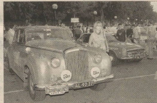
Суратда: пойгадан лавҳа.