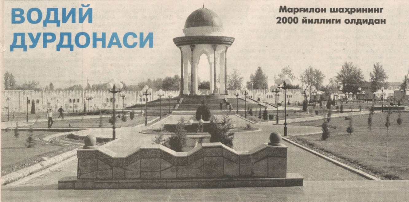
Марғилон шаҳрининг 2000 йиллиги олдидан

Мустақиллик йилларида қадим Марғилон тамомила янги кийимга кийиб, улкан ўзгаришлар томон юз тутди. Қисқа давр ичида ўнлаб маъмурий ва маданий-маширий иншоотлар бунёд этилди. Айниқса, замонавий услубда қайта жилонланган Бурхониддин Марғинович ёдгорлик мажмуи нафақат шаҳарнинг, балки бутун водийнинг дурдонасига айланди. Янги замон билим масканлари бўлган педагогика ва тиббиёт коллежлари фойдаланишга топширилди. Маъмуржон Узоқов номидаги маданият ва истироҳат боғини улғувор арка, машҳур инсонлар хиббони беэзаб турибди. Янги йўллар қурилди, боғ ва хиббонлар яратилди.