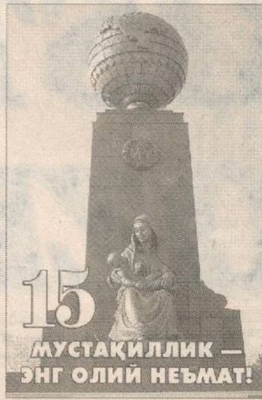
15 МУСТАҚИЛЛИК — ЭНГ ОЛИЙ НЕЪМАТ!