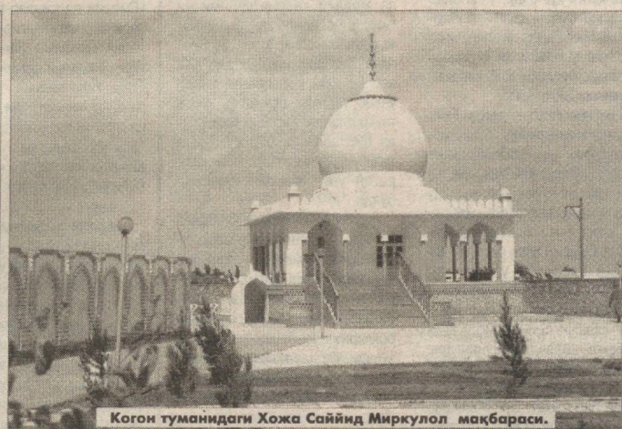
Когон туманидаги Хожа Сайид Мирқуллоқ мақбараси.