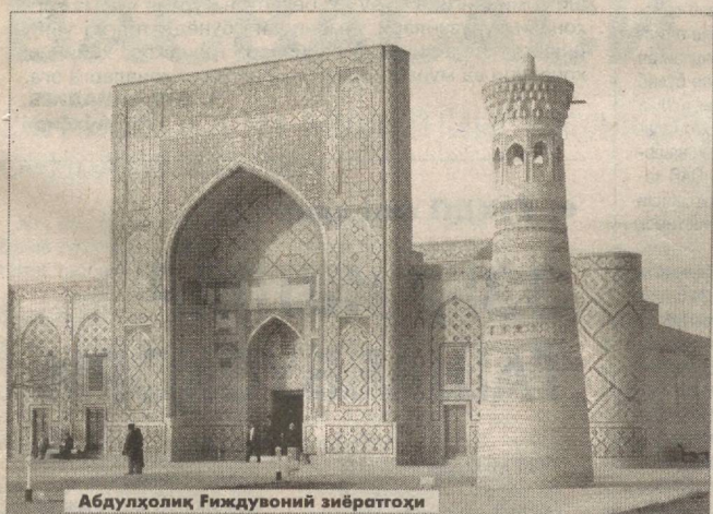
Абдуллох Гиждувоний зияратгоҳи