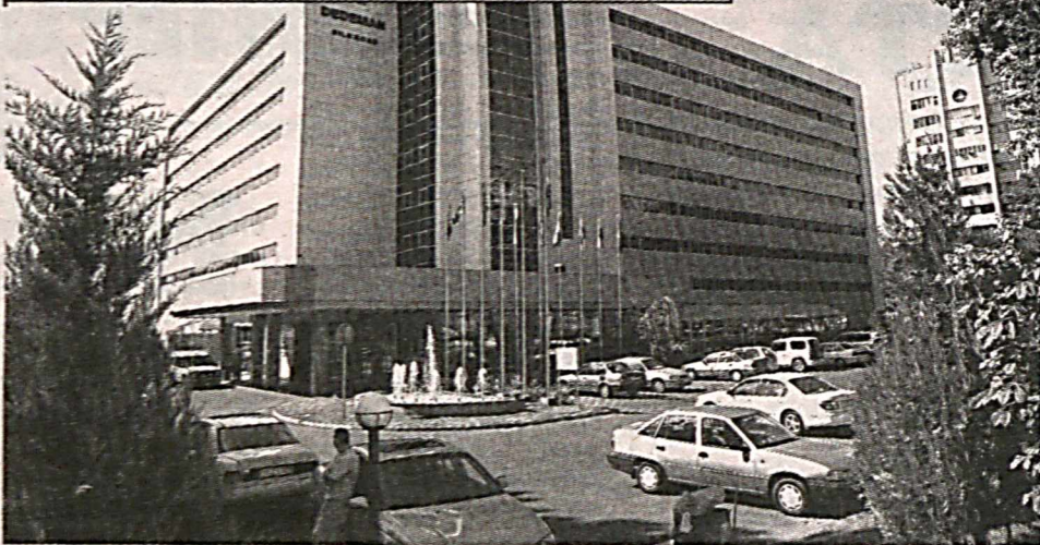
Аккуратные автостоянки - украшение города.

ружено и много других нарушений. Например, много случаев, когда услуги оказывались без выдачи кассового чека, что является большим нарушением. Квитанции об оплате за оказание услуги по парковке автомобилей должны выдаваться обслуживающим персоналом по утвержденному прейскуранту, вывешенному на видном месте. В квитанции должна быть отметка о заезде и выезде с парковки или стоянки. (Закон «О защите прав потребителей» ст. 10).