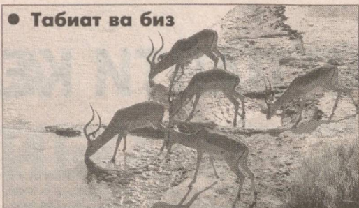
● Табиат ва биз

инсоннинг табиатга нооқилона муносабати, табиий ресурслардан пала-партиш фойдаланиши, антропоген факторларнинг биохилма-хилликка салбий таъсири натижасида ҳайвонот оламидаги баъзи турлар қарилиб кетди, яна бир қанчаси эса йўқ бўлиб кетиш арафасида турибди