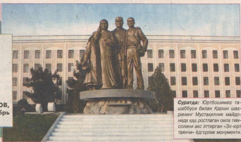
Суратда: Юртбошимиз ташаббуси билан Қарши шаҳрининг Мустақиллик майдонидики қад ростлаган оила тими солини акс эттирган «Эл-юрт таянчи» ёдгорлик монументи.