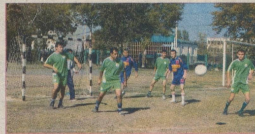
Суратда: турнирдан лавҳа.