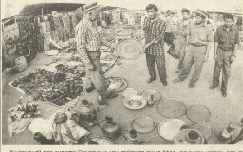
Хунармандӣ дар вилоти Самарқанд ҳам пайваста рушд ёфта, анъаноти ниёгон дар ин бобат эҳе меёбад.