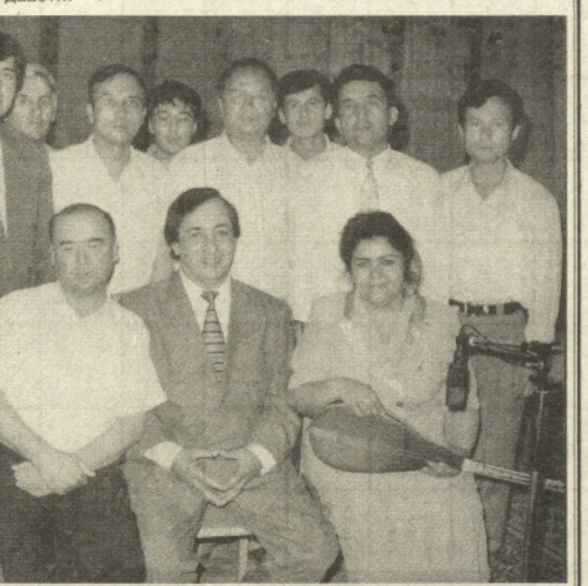
Гуруҳи Чирабек Муродов дар ихтиаи мусиқорҳои Ўзбекистон.