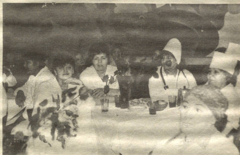
ТОШКЕНТ ШАҲАР СОЦИАЛ ТАЪМИНОТИГА ҚАРАШЛИ 1-БОЛАЛАР ИНТЕРНАТИ ТАРБИЯЧИЛАРИ

Шифокорларнинг изоҳ беришича, «дебилга ураган