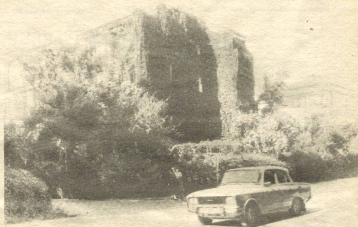
Собит МУСАЕВ сурати

да кўп. Шулардан бири сўзлашгичлардир. Давлатимизнинг янги бир поғонага кўтарилиш даврида бундай сўзлашгичлар ёки шунга ўхшаш қўлланмалар ниҳоятда кўпаяди ва бу табиий бир ҳол. Ҳозирча бир-иккита яхши сўзлашгичлар чиқди. Лекин тилни чуқур ўрганиш учун булар камлик қилади. Энди хусусан менинг сўзлашгичим ҳақида гапирадиган бўлсак, аввало яхши баҳойингиз учун раҳмат, лекин 22 млн. аҳоли мавжуд мамлакат учун 10000 нусхада чиққан бу сўзлашгич нима бўлади? Яхшими, ёмонми ўзида зарур ахборот сақлаган бу манбаларнинг ҳалққа нафи тегади деб ўйлайман. Одатда сўзлашгичларда иборалардан кейин, унинг таржимаси бериллади. Лекин урғулар кўрсатилмайди. Энди бир жиҳатга эътибор беринг. Мактабни ўрта баҳо билан тугатган ўқувчи бунини тушунмаслиги мумкин. Инглиз тили ҳақиқатдан ҳам мураккаб тил, бу тилни бутун дунё ўзаро муомалада қўлайди. Шундай экан бу тилда хато гапиришнинг ўзи катта хато. Уч нарсага эътибор бериш керак. Биринчиси, ибора ва сўз маъносига, иккинчи-