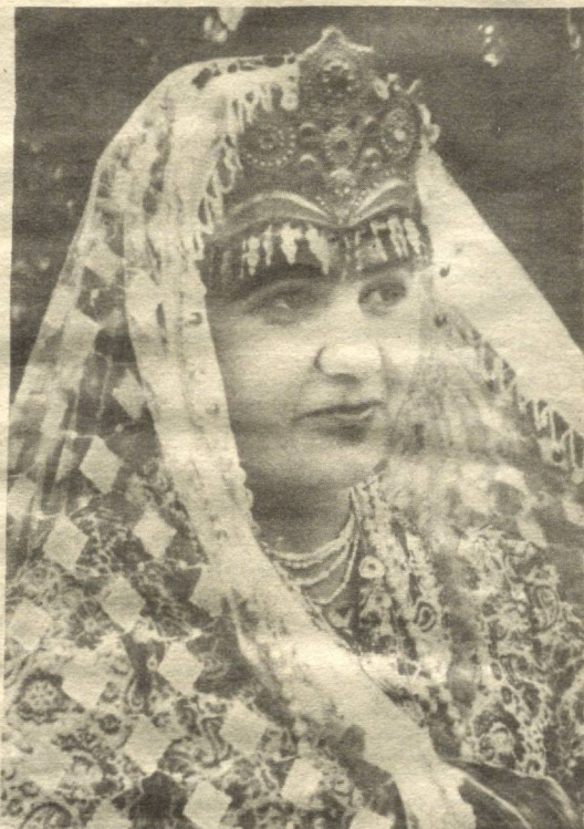
Баланд йўлнинг бошларида, Бахт учмоқда беланча, Кўзларингни ёшлаб юрма, Қулавергин келин-ак.

Инсоннинг табиати қизиқ. Унга тушунмаган нарсасини тушунтириш қийин. Тахририятимизга оила қуриш истаганида келувчи айримларни