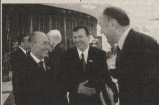
хуқуқбунёд иқдоми муҳим мегардад. Аз он ҷумла, лоихаи қонуни «Дар бораи даровардани тағйироту иловаҳо ба Конституцияи Ҷумҳурияти Ўзбекистон» ва «Дар бораи интихоботи Олий Маҷлиси Ҷумҳурияти Ўзбекистон» (қироати аввалу таҳрири нави мавриди баррасӣ қарор гирифта, яқумӣ қабул, дуҷум дар қироати аввал маълум доништа шуданду асос барои таҳия намулдани онҳо қонунҳои конституцияи «Дар бораи натиҷаҳои тағйироту иловаҳо ба Конституцияи Ҷумҳурияти Ўзбекистон» ва «Дар бораи Палатаи қонунбарории Олий Маҷлиси Ҷумҳурияти Ўзбекистон» гардидаанд, ки дар иҷлосияҳои гузаштаи парламент қабул гардида буданд.

нави баровардани ислохоти демократиконӣ ва тақомули мамлақату ҷамъиятамон ва ҳамзамон идомати додани қорҳо, ки мо ба он даст задаем, имрӯзо вазиҳои муҳимтарини мо мебошанд. Яъне соҳтани давлати демократии ҳуқуқбунёд ва ҷамъияти озоди шаҳрвандӣ мақсади асосии мост. Шартҳои муҳимии давлати демократӣ ва ҷамъияти шаҳрвандӣ ин баланд бардоштани нақш ва аҳамияти муассисони ғайридавлативу ҷамъияти дар ҳаёти чомеа мебошад. Ин, дар навбати худ, амалан дар ҳаёт таъбиқ кардани усули «Аз давлати пуркувват» мебошад. Ва он бошад, давра ба давра ва тадриҷан ҳам намулдани нақши сохторҳои давлатиро дар ҳаллу фасли бисёр вазиҳо, ки ба қараёнҳои иҷтимоиву иқтисодӣ, қабл аз ҳама алоқаманд мебошанду бод. Бо назардошти ана ҳамин вазиҳои умдаву халқунанда ба Қонуни Асосамон, тағйироту иловаҳо дохил карда шуданд ва он бешак пеш аз ҳама барои аз як гиребон сар бароварда фавқулоддаи пеш бурдани шаҳсонии ҳокимият мақомоти қонунбарорӣ, иҷроия ва судӣ, мушаккамӣ на арзи амал кардани онҳо мусоидат мекунанд. Барои боз ҳам доминандор гардидаи ислохот дар тамоми соҳаҳои ҳаёт қумаки қалон мерасонад. Дар мақолаҳои минбаъда дар ин хусус маълумот хоҳем дод. Т.НОДИР. Дар суратҳо: лаҳзаҳо аз иҷлосияи ёздаҳуми Олий Маҷлиси давлатӣ дуҷум.