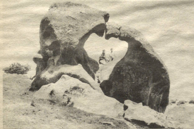
Эргаш ҚУЛМУРОДОВ сурати