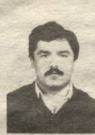
гандан сўраб қолувчи, ДУСТАРИНИНГ. 3-Автокомбинатинг 3-колоннаси йигитлари

қалбимиздан муборакбод этамиз. Оллоҳдан Сизга узоқ умр ва бизларнинг бахтимизга сиҳат-саломат юришингизни тилаймиз. Доимо Сизга нибатан фарзандларингиз, неварра, келинларингиз қўли кўксиди, боши таъзимдан сўраб қолувчи, ДУСТАРИНИНГ. 3-Автокомбинатинг 3-колоннаси йигитлари