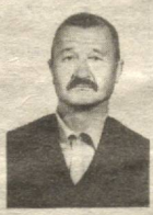
Зимда бўлсин. Деб азиз ОНАЖОНИМИЗ ва ФАРЗАНДАРИНИНГ.

қалбимиздан муборакбод этамиз. Оллоҳдан Сизга узоқ умр ва бизларнинг бахтимизга сиҳат-саломат юришингизни тилаймиз. Доимо Сизга нибатан фарзандларингиз, неварра, келинларингиз қўли кўксиди, боши таъзимдан сўраб қолувчи, ДУСТАРИНИНГ. 3-Автокомбинатинг 3-колоннаси йигитлари