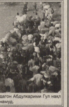
дагон Абдулқарими Гул нақл намуд.

Ҳоло аз 40 млн. паноҳандагон ҷаҳон 35 фоизашро ҷавонони аз 12 то 24 сола ташкил медиҳад. Аз ин боис СММ қарор намудааст, ки имсол ин рӯзро зери шоири эътибори бештар ба қишри ҷавони гузегаргон қайд намояд. Мудирияти Комиссияи олии СММ оид ба паноҳандагон ҳоло ба 7,7 млн. ҷавонони паноҳандаи то 18 сола кӯмак мерасондад. Ҳанӯз дар бисёре аз кишварҳои Африқо, Осие ва Амрикои Ҷанубӣ теъдоди паноҳандагон зиёд боқӣ мемонад. Дар Афғонистонӣ ҳамсоя пас аз шикасти режими Толибон беш аз 1,8 млн. нафар ба вақтани худ баргаштааст. Аз ҷумла аз кишварҳои ИДМ беш аз 5 ҳазор паноҳанда ба ҳоки худ бозгаштаанд. Паноҳандагонҳои афғонистонӣ дар Ўзбекистон қисман зери ғамхорӣ намоёндагии СММ қарор дорад ва дар ин бобат намоёндаи тозаъинишудаи Комиссияи олии СММ оид ба паноҳан-