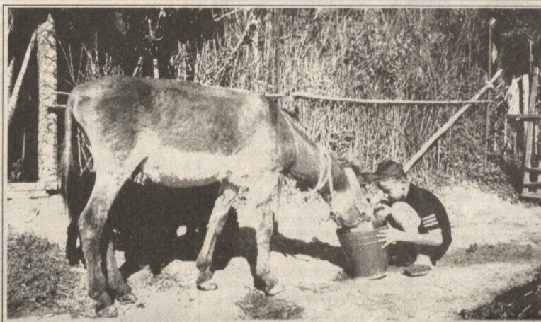
Таътил — дар дехот. Сураат-лаҳзаи Т. ХОВАРИ.

Холо дар Ўзбекистон қариб дар 330 мактаби таълими ҳамагонӣ таълим тоҷикӣ бурда мешавад. Барои ин мактабҳо дар асоси «Консепсияи омўзиши давлатии таълим аз забон ва адабиёти тоҷик» барин ҳуҷҷатҳои муҳим, ки дар асоси қонуни Ўзбекистон «Дар бораи таълим» оғдарида шудаанд, баробари ҳамаи мактабҳои дигар амал мекунанд. Бо сазо эҳтимоми Шўрои илмӣ-методи забон ва адабиёти тоҷик, ки чандин сол инҷониб дар назди Маркази таълими ҷумҳури фазолият дорад, таи солҳои охири барномаву дастурҳои нави таълими забон ва адабиёти тоҷик дар мактабҳои Ҷумҳурии Тоҷикистон таълим мегарданд. Ки дар таълими он дономандони мактабҳои олии, омўзгорони соҳибтаърибаи мактабҳои ҷумҳури иштирокдоранд. Дахҳо номгуӣ китобҳои дарсӣ аз ҷониби нашриёти тоҷикӣ гуногуни Ўзбекистон мунтазам нашр мегарданд. Дар ин ҳола муҳаррирони мунтаҷимони захираҳои нашриёт, кормандони рўномаи «Ҷумҳурии «Овози тоҷик», устодон ва омўзгорони мактабҳои олии ва миёна кўшиши зиёде ба ҳарч меҳмонам.