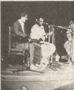
Гуруҳи «Шамс» аз Чумхурии Исломии Эрон дар «Таронаҳои Шарқ» — 1999» аз бехтаринҳо шинохта шуд.

Ўзбекистон сафар мекунам. Аз бозиди Самарқанд хеле хушам омад. Бисёр мадуррам, ки сафари ман ба рӯзиҳои чашнвораи мусиқӣ баробар омад.