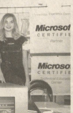
Хисоб менавад. «ЎзТел-2003» технологияи навтарин, хизматрасонийи замонавиро намоиш кард. Нишон дод, ки дар Ўзбекистон ҳам Интернет бо қадамҳои ағзим пеш менавад, насли чавоний кишвар ба китобхонаи чачоний, илму доғиши ба даст овардани ағли олам даст хоҳад ёфт. Шўбҳаҳои «Радиотаччизот ва алоқий радиой», «Телефоний мобилый», «Алоқий қайғоний», «Интернет», «Манбаҳои энергияи доғий», «Компютерий оғоний мағсуз», «Таъминоти барномаҳои», «Таълим», «Таъмир ва хизматрасонийи боқалолат», «Воситаҳои муҳағизатий информатсионий», ки аз қониби компанияҳои Британияи Кабир, Исроил, Олмон, Қазоқистон, Русия, Латвия, Қорей, Словакия, Туркия, Украина, Ўзбекистон, Швейтсария, Чолон ва ғайра намоиш ёфтад, дар ду рӯз ба зинаи аз 12 ҳазор нафар тамошбоний таассуроти қалон гузошт.

Дар саммити байналхалқийи чоруми Тошканда аз 10 то 12 декабри ҳамин сол дар Женеваи Швейтсария баргузор мешавад. Зинаи дуғом 16-18 ноябри соли 2005 дар Тунис баро хоҳад шуд. Саммити, ки дирӯз дар Тошканда гузашт, оғадиғай ба тадбирҳои ҷиддитарини чачоний дар роҳи