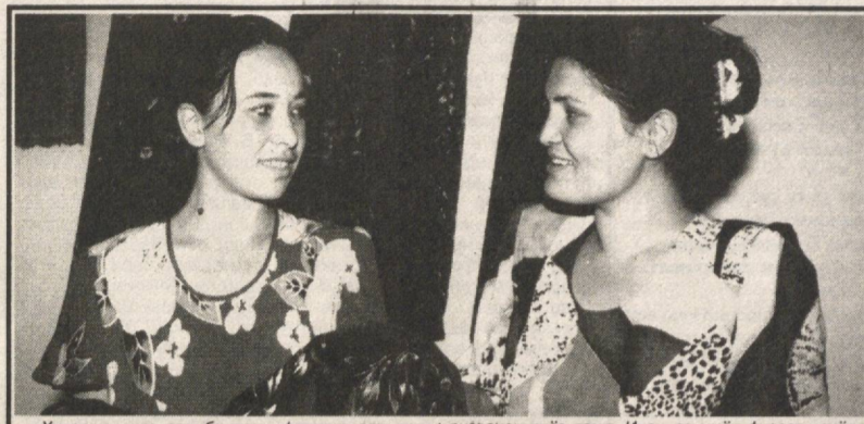
Хунарманд ва соҳиби илму фарҳанг дар...