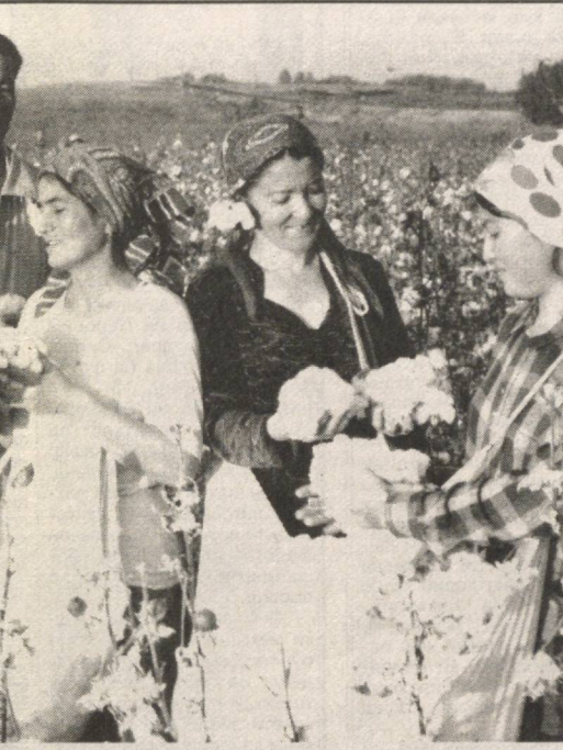
Пахтакорон аз ҳар соату рӯи мавсими гуноҷии «тиллои сафед» босамар истифода мекунанд. Бояд гуфт, ки бори тезу босифат чамъ овардани ҳосили ба арақи чабини рӯндашуда ба пахтазор ҳашарчиён низ сафарбар карда шуданд. Вале на ҳамаи ширкатҳои чамъоварӣ ба ҳашарчиён ниёз доранд. Хоҷагии ширкати ба номи Собир Раҳимови