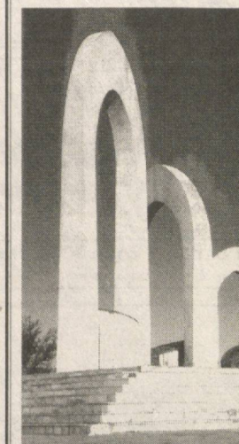
(Аваллаш дар сах. 1).

Рӯзи дувуми тантанавии идона дар шаҳри Учқудуқ баргузор гардид. Ҳамаи меҳмонан, аз ҷумла, журналистони дохилӣ ва хориҷӣ нис дар ин маросим иштирок намуданд. Сипас, тантанавии идона ба шаҳри Зарафшон кӯчид. Ин шаҳр нис дар биёбони Қизилқум арзи вучуд намуфтааст ва ҳоло дар он ҳазорҳо нафар ба қору зиндагӣ машғуланд. Дар ин шаҳри навбунёд мактабу литсейҳои зиёд сохтаанд. Кинотеатру марказҳои фароғат дар ихтиёри бошандагонии ин шаҳр қарор доранд.