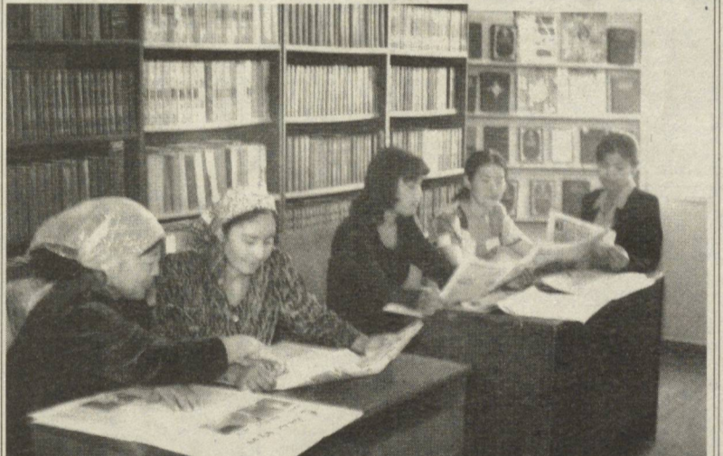
Китобхонаи ба номи Алишер Навоии ноҳияи Окқўрғон ба ҷои дўстдоштанӣ ҳурду калони гирду атроф табиатӣ ёфтааст. Дар ин ҷо ҳама адабиётӣ дилхоҳи ҳурро ёфта мутолиа карда метавонанд. Ин аст, ки шумораи азобони он рӯз аз рӯз меафзояд. Дар ин ҳиссаи китобдорон калон аст.

меоварад, маҳз бо ташаббус ва раҳнамоии сарвари мамлакатамон Исрол Каримов бунёд гардидаш ба забон гирифта шуд. Донишҷӯёни сайёҳи ниҳоят ба базае ки дар он футболбозони ҷамоаи аққачини мамлакат оиди футбол машқ мегузаронанд, омаданд.