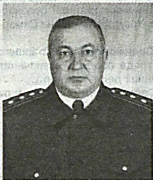
АТАЕВ Икрам Исмаилович – начальник ППС и ООП УВД Хорезмской области.