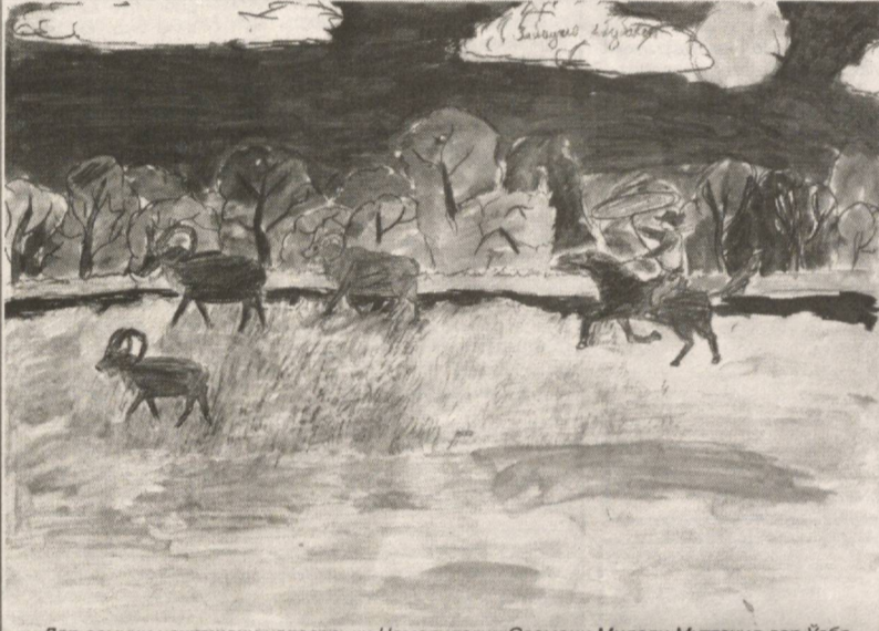
Дар озмуни наққошони наврасе, ки Намояндагии Созмони Милали Муттаҳид дар Ўзбекистон...