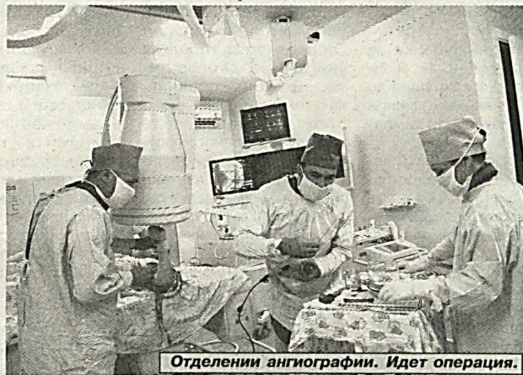
Отделении ангиографии. Идет операция.

Ну что же, эту уверенность приобрили и мы, поближе познакомившись с работой центров и отделений госпиталя. Прежде всего, о территории. Все продумано до мельчайших тонкостей, ведь и роскошные зеленые насаждения, и многочисленные фонтаны, удобные скамейки под навесом и аллея для пеших прогулок – все это одна из важнейших составляющих эффективного лечения. Допустим,