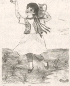
Бахшанда. Бо вучуди он, ки чепарадозиеро (портрет) меназираш, дар дил ниёти тасвири он манзараҳо пайдо шуд...